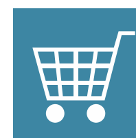
Поддержка в точках продаж