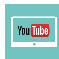
Блок «Узнавайка» YouTube