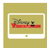
Блок «Узнавайка» Канал Disney